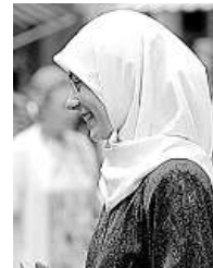
VELO Per i bambini no.

In buona sostanza, osserva Ghiringhelli, si tratta proteggere il libero sviluppo di una bambina e la sua integrazione nella nostra società. L'interesse pubblico «esige anche che i valori fondamentali della nostra società e del nostro Stato di diritto siano protetti». La scuola dovrebbe quindi servire da base legale per evitare sotto-