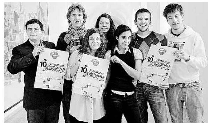
PARTECIPAZIONE Il comitato del parlamento giovanile si attende un'adesione di almeno settanta coetanei.

in sintonia con gli obiettivi (promuovere lo scambio d'idee e favorire la partecipazione attiva dei giovani alla vita politica) l'attività del Consiglio cantonale dei giovani si svolgerà sull'arco di tre giornate. Il 13 marzo si terrà la giornata preparatoria durante la quale intervengono alcuni ospiti; in seguito i partecipanti, divisi in gruppi tematici, inizieranno la discussione sull'argomento dell'anno. Il 7 maggio si svolgerà l'assemblea plenaria: saranno raccolte e formalizzate le idee nate e sviluppate in marzo e sarà stilato un documento indirizzato al Consiglio di Stato. L'incontro con gli esponenti del Governo cantonale è fissato per il 17 settembre: le proposte dei giovani saranno discusse direttamente con i consiglieri di Stato. Al Consiglio dei giovani possono partecipare tutti i ragazzi e le ra-