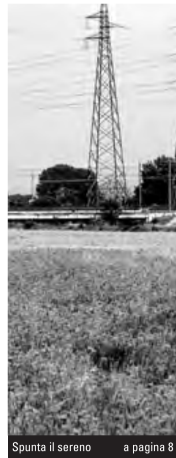
Spunta il sereno