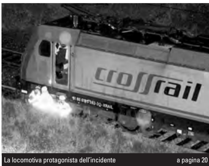
La locomotiva protagonista dell'incidente