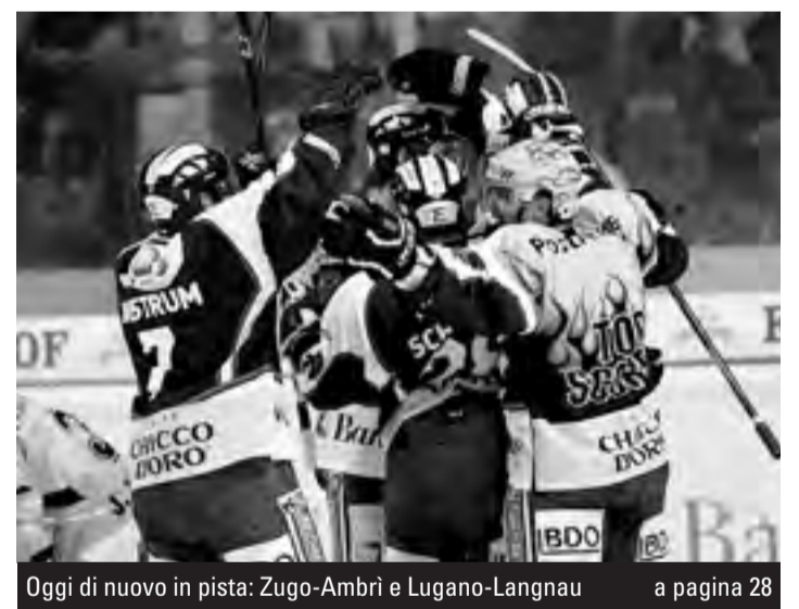
Oggi di nuovo in pista: Zugo-Ambri e Lugano-Langnau