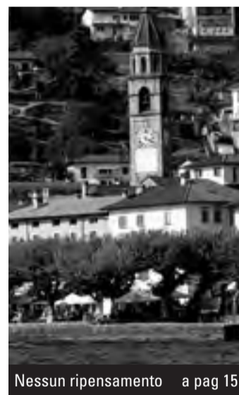
Nessun ripensamento a pag 15

Da Ascona 'no' definitivo alla Casa del cinema